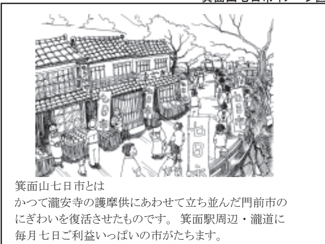
箕面山七日市イメージ図

箕面山七日市とはかつて瀧安寺の護摩供にあわせて立ち並んだ門前市のにぎわいを復活させたものです。箕面駅周辺・瀧道に毎月七日ご利益いっぱいのお市がたちます。